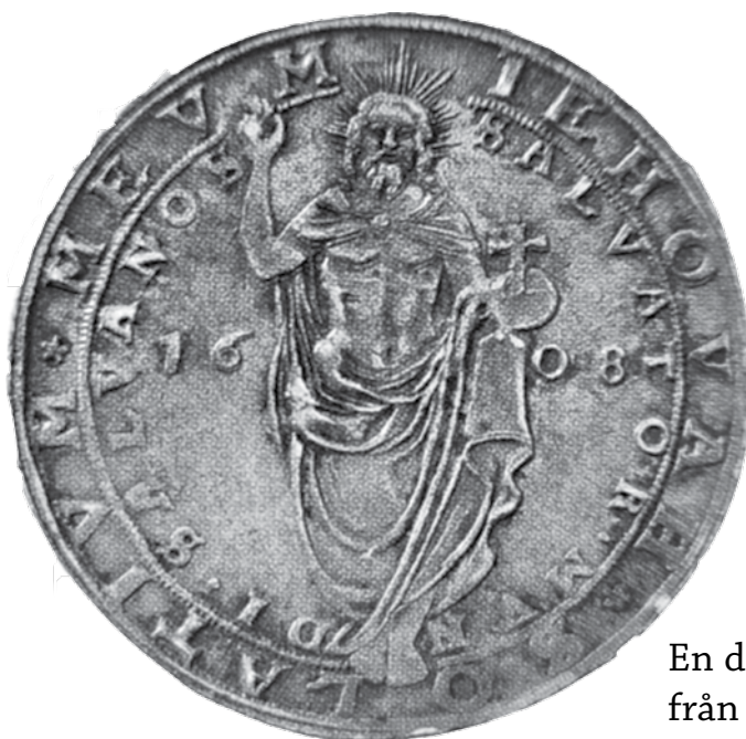
En daler från 1608.

för de Besche var 300 daler per år samt en bestämd taxa för till bruket levererad malm, ved, kalksten, stockar och hö. 300 daler motsvarar 50 månadslöner för en gruvarbetare, en ko kostade ungefär 5 daler vid denna tid. 2