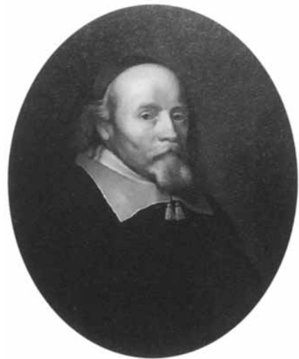
Louis de Geer.

Lastageplatsen var vid denna tid Läggesta bro vid Räckstaåns utlopp i Mälaren. Från bruket fraktades järnvarorna landvägen till ett magasin nedanför fallen vid Räcksta där Krutbruket nu