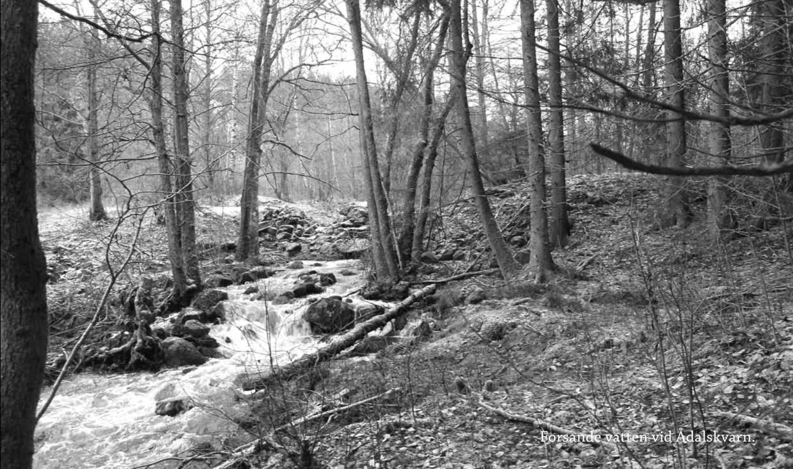
Forsande vatten vid Ådalskvarn.

förslaget. Trots protesterna blev beslutet enligt följande: "... då intet verkssammare korrektion häremot funnes än täflan, samt dessutom serskildt med ifrågavarande såganläggning inträffande att å densamma allmänheten kunde hela året igenom med sågning orden teligen betjenas, utan inskränkning till wissa årstider ansåge Härads Rätten denna anläggning med menighetens förmån synnerligen öfverrensstämmande och tillstyrkte därför.."