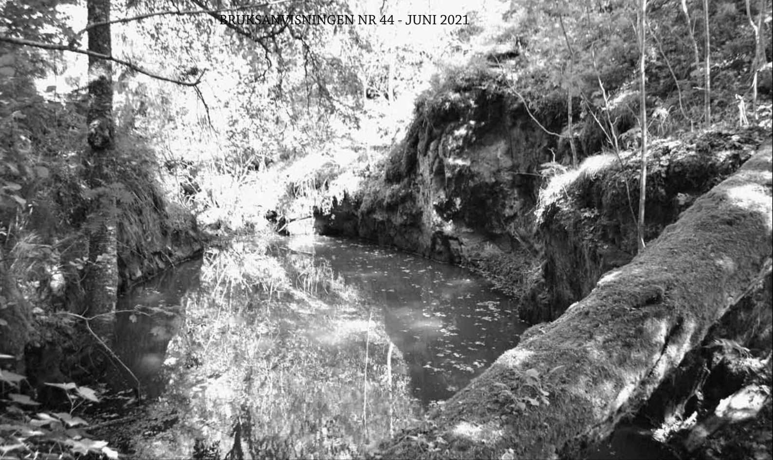
Ovan: Nere i det stora vattenfyllda gruvschaktet i Älgsjöbackens gruva, fotograferat sommaren 2018. Nedan: En fullskalig modell av den smalspåriga järnvägen har byggts upp vid Älgsjöbacken.