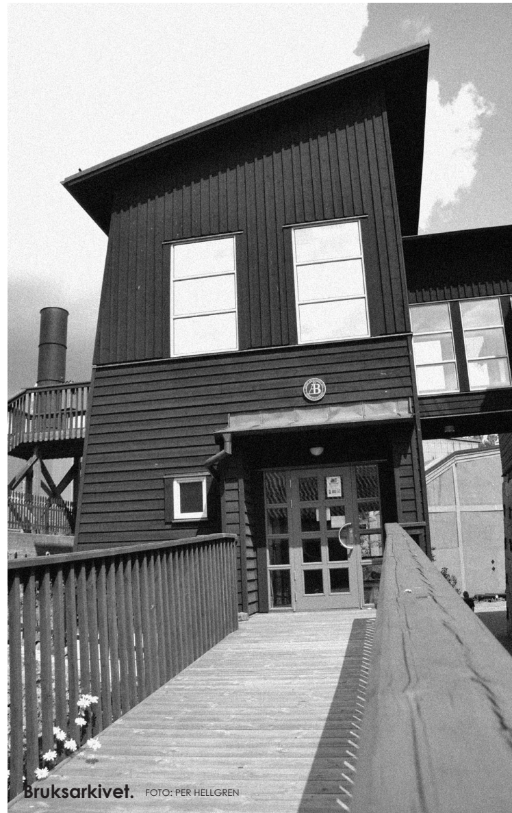
Bruksarkivet. FOTO: PER HELLGREN