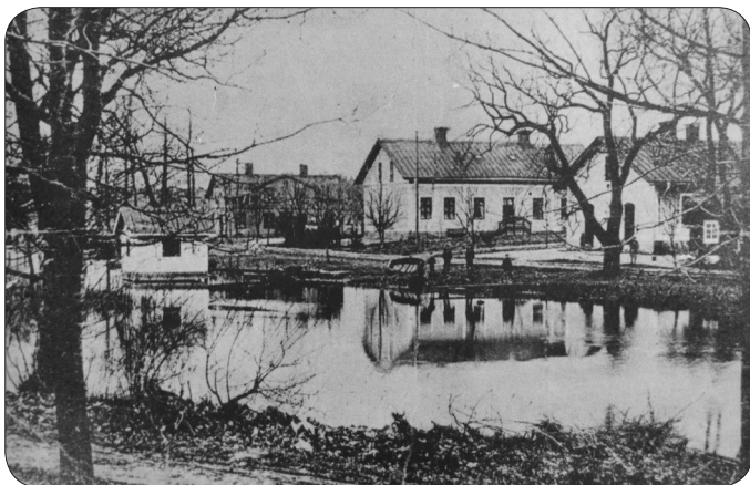
Räckstaån med klapphus och slaskbryggor.