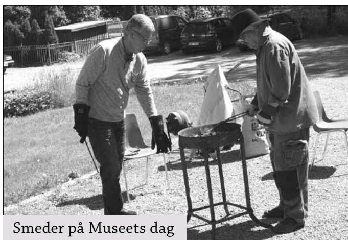
Smeder på Museets dag

Totalt besöktes arkivet av 437 personer, det högsta på flera år. Enbart Museets dag drog 106 besökare. ■