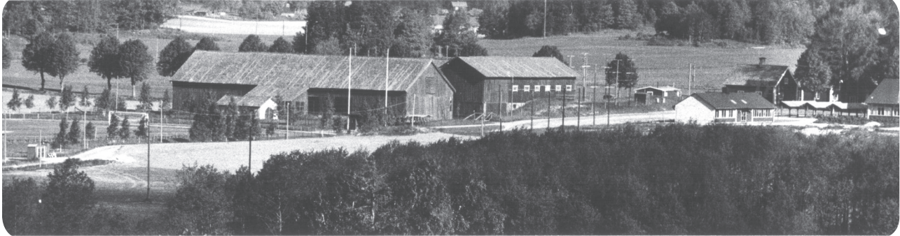
Solberga by 24 april 1959. När Bruksvallen byggdes vid Solberga fanns fortfarande stall och logar kvar.